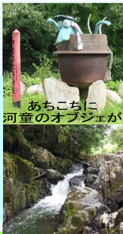
あちこちに河童のオブジェが

国道486号線沿い、豊栄町と三原市大和町との境にあります。当駅から車で約12km(20分くらい)です。