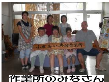
作業所のみなさん